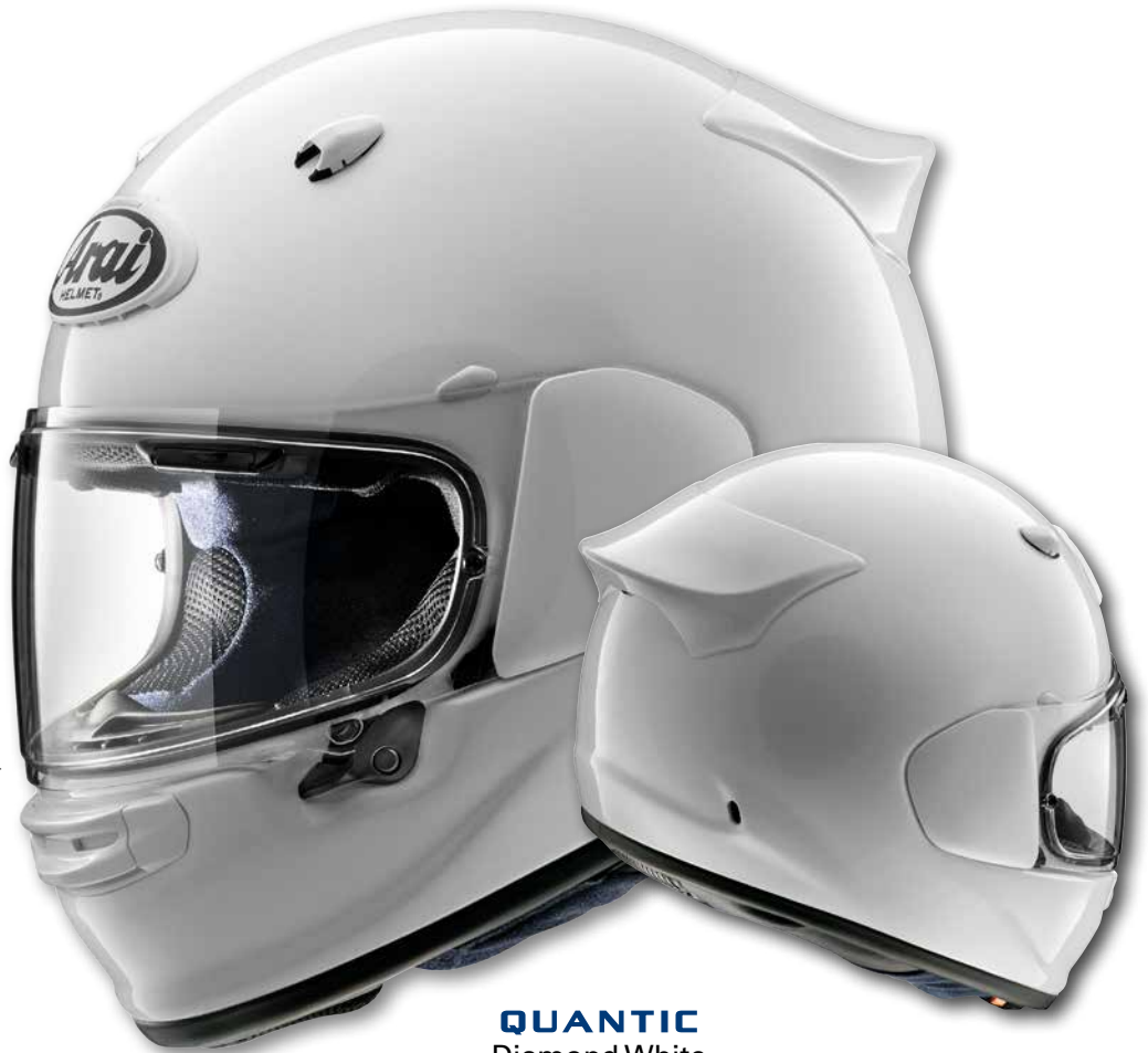
QUANTIC Diamond White

** Innovation von Arai, exklusives Angebot